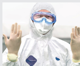
PSA - Persönliche Schutz-Ausrüstung