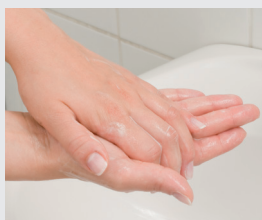
Hände waschen, desinfizieren und cremen